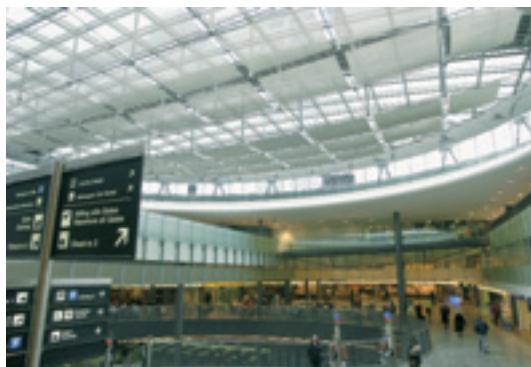
Terminal Flughafen, Zürich