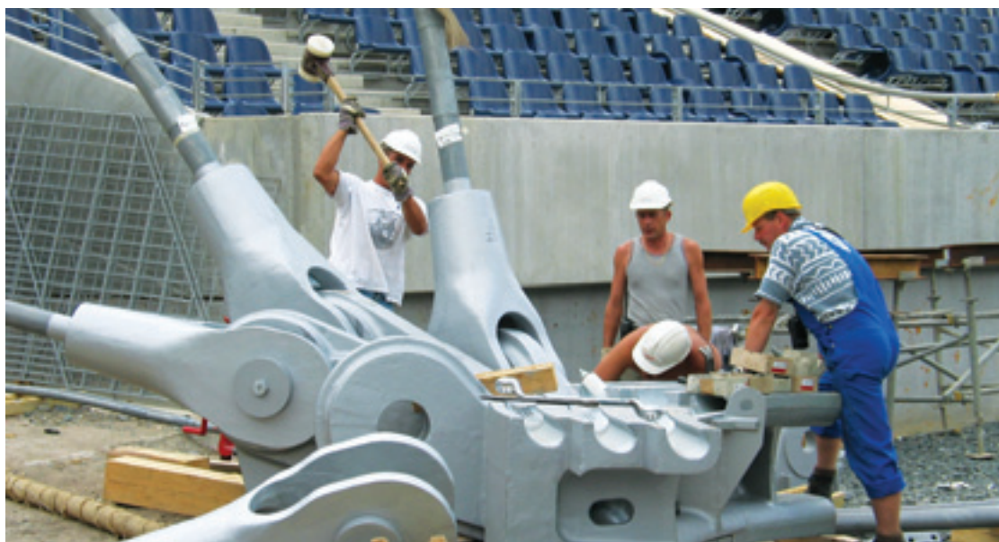
WM-Waldstadion Frankfurt, Deutschland

Wo Seilkräfte und Seilzüge zur Perfektion werden.