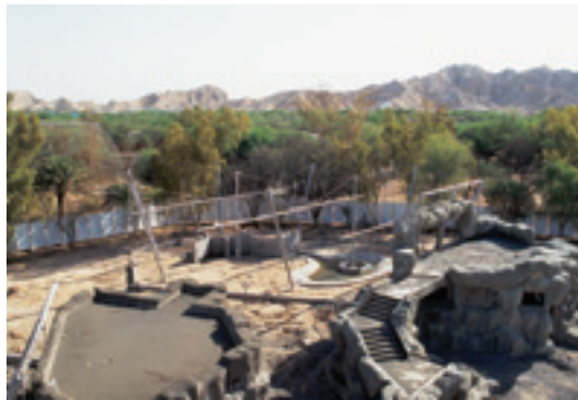
Zoogehege Al Ain, Arabische Emirate