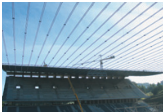
EM-Stadion Braga, Portugal