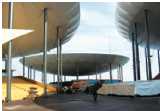
Galets Expo, Neuenburg