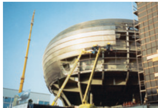
Edelstahlgewebe Bertelsmann Expo-Pavillon, Hannover