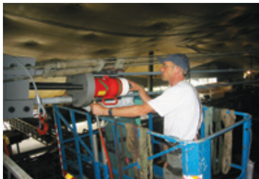
Seilmontagen Olympiapark, München