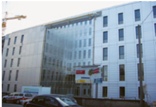
Jakob Burkhard-Haus, Basel

Unsere Montageteams sind seit Jahren auf der ganzen Erde gefragt: Beratend, mit Montageplanung, mit erfahrenen Teams für die Arbeit