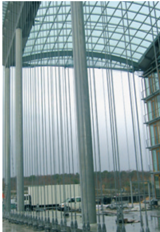
Verwaltungsgebäude Lufthansa, Frankfurt

Engineering für Seilzüge, eigene Spezialwerkzeug-Entwicklungen für jede Montagesituation sind Leistungen, wovon unsere perfekt eingespielten Seilschaften und Kunden profitieren.