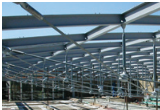
Spanischer Bau, Köln